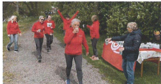
Löpare från Friskis.