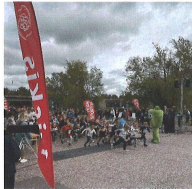
Starten för ST loppet